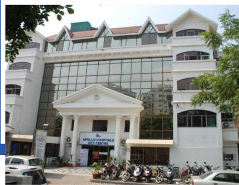
અપોલો સીટી સેન્ટર

ભાટ, જી.આઈ.ડી.જી. એસ્ટેટ, ગાંધીનગર- ૩૮૨૪૨૮ ફોન : ૦૭૯ ૬૬૭૦૧૮૦૦ / હેલ્થ ચેક ડીપાર્ટમેન્ટ : ૭૬૯૮૮ ૧૫૦૨૮ એપોઈન્ટમેન્ટ ડેસ્ક : ૭૬૯૮૮ ૧૫૦૦૩ / ૦૭૯-૬૬૭૦૧૮૮૦