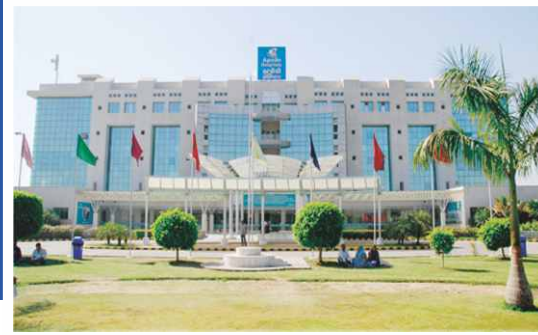
અપોલો હોસ્પિટલ્સ ઈન્ટરનેશનલ લી.

મોબાઇલ : +૯૧-૭૦૪૩૪ ૦૪૫૭૪ | ઈ-મેઇલ : drjinesh@gmail.com